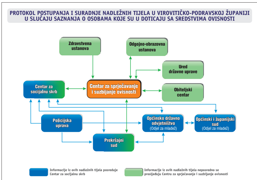
Shema Protokola iz 2007. godine